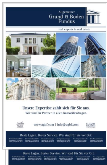
Durch die Mouseover-Funktion vergrößert sich Ihre Anzeige