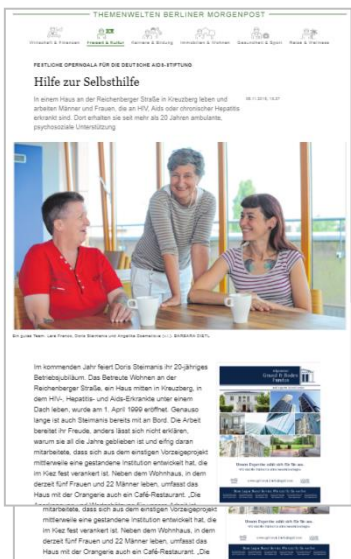
Auszug redaktionelle Themenseite mit integrierter Anzeige