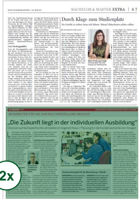
Beispiel-Advertorial 1/2 Seite

Advertorial BILDUNGS TIPP 1/2 Seite tabloid (248 mm x 172 mm) statt: 4.070,00 € Preis: 2.035,00 € Angebot gültig für Bildungsinstitute / Hochschulen