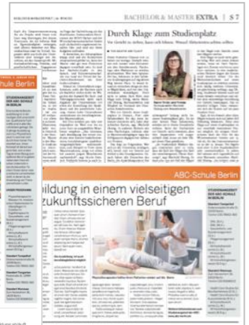
1/2 Seite BILDUNGSTIPP