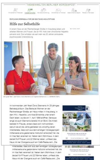
Auszug redaktionelle Themenseite mit integrierter Anzeige