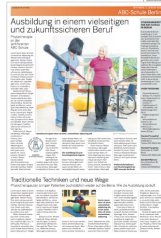
1/1 Seite BILDUNGSTIPP

Mit dem BILDUNGSTIPP vermitteln Sie positive Werte Ihrer Einrichtung / Ihres Unternehmens, welche interessierte Fachkräfte und Bewerber sehr schätzen. Die redaktionelle Anmutung hebt sich von den klassischen Anzeigen deutlich ab. Die Gestaltung erfolgt im Verlag, Sie liefern uns Ihr Text- und Bildmaterial.