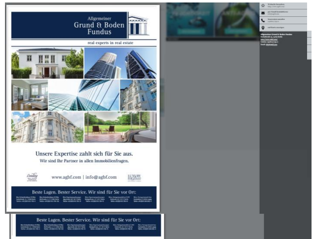
Per Klick öffnet sich ein Layer mit allen Informationen aus Ihrer Anzeige

Die Preise für den Onlineanteil berechnen sich nach der Größe der gebuchten Printanzeige: bis 299 Gesamt-mm zzgl. 35,00 € Onlineanteil, zwischen 300 – 699 Gesamt-mm 75,00 € Onlineanteil, zwischen 700 – 999 Gesamt-mm 175,00 €, ab 1.000 Gesamt-mm 250,00 €. Der Onlineanteil gilt je Anzeige, ist AE-fähig, jedoch nicht rabattfähig. Online- und Printleistungen sind nicht einzeln abnehmbar.