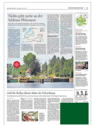
Griffecke Tipps (B 121 mm x H 100 mm) 3.560,00 €