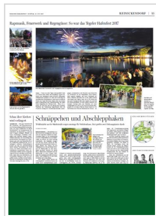
Streifen (B 375 mm x H 100 mm) 8.170,20 €