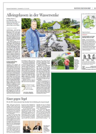
Eckfeld (B 184,5 mm x H 250 mm) 13.350,00 €