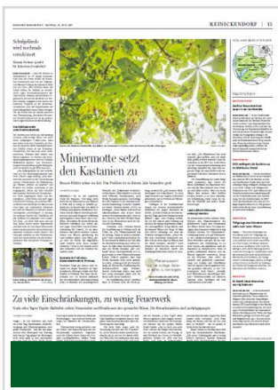
Titelstreifen (B 375 mm x H 50 mm) 4.697,87 €