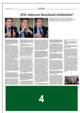
1/4 Seite quer