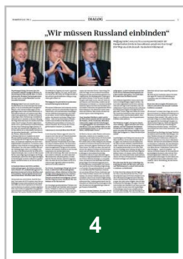
4 1/4 Seite quer