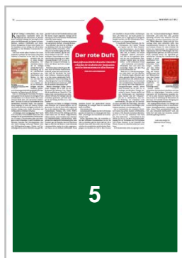
5 1/2 Seite quer