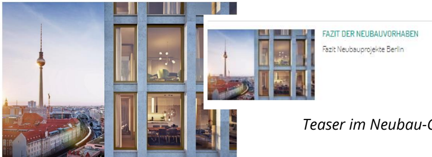
Teaser im Neubau-Channel

In Berlin entstehen aktuell zahlreiche Neubuprojekte. Im Trend: Wohntürme wie das „Grandair“ am Alexanderplatz.