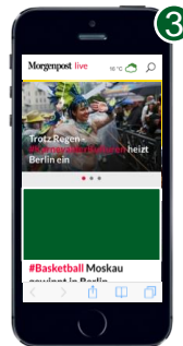
Werbemittel: Mobile Content Ad 2:1 Maße: 300 x 150 px