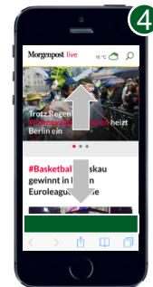
Werbemittel: Mobile Sticky Ad 6:1 Maße: 300 x 50 px