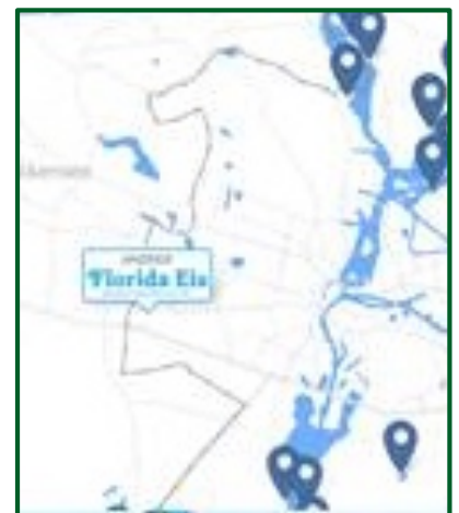
Integration innerhalb der interaktiven Karte

Beispiel: Badestellen Berlin mit Florida Eis