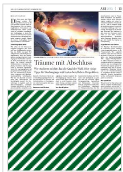
1/2 Seite Advertorial B 248 mm x H 185 mm 7.621,25 € 2/3