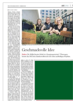
1/4 Seite – Ecke B 139 mm x H 150 mm 3.697,50 € 2