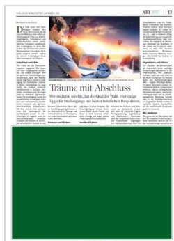
1/2 Seite B 248 mm x H 185 mm 7.621,25 € 2