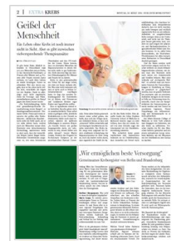
Kompaktformat B 92 mm x H 150 mm 2.490,00 € 2