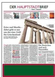
Titelstreifen 3 B 375 x H 80 mm