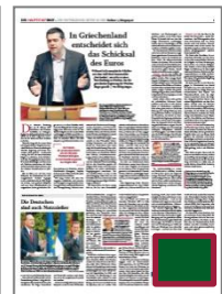
Griffecke B 121 x H 100 mm

Einzelpreis 4 5.954,15 € 34.171,63 € 17.085,82 € 8.542,91 € 11.167,20 € 2.820,00 €