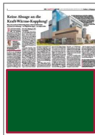
1/2 Seite B 375 x H 264 mm