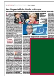
Eckfeld B 184,5 x H 264 mm