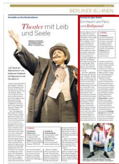
Advertorial 1/3 Seite