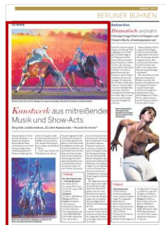
Advertorial 2/3 Seite