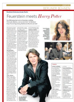
Advertorial 1/1 Seite