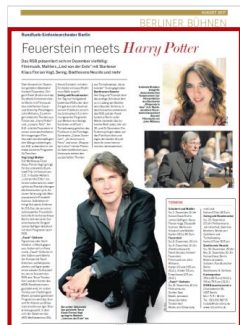
Advertorial 1/1 Seite