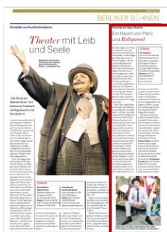
Advertorial 1/3 Seite