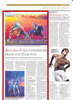
Advertorial 2/3 Seite