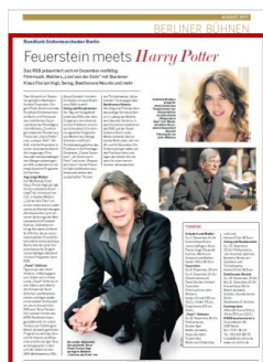
Advertorial 1/1 Seite