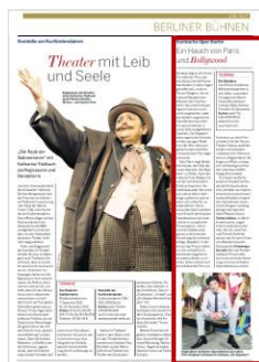
Advertorial 1/3 Seite