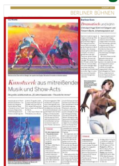
Advertorial 2/3 Seite