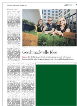
1/2 Seite (B 248 mm x H 185 mm) 5.500,00 €