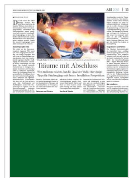
1/1 Seite (B 248 mm x H 370 mm) 9.900,00 €