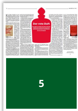
5 1/2 Seite quer