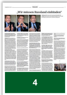
4 1/4 Seite quer