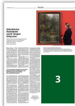
3 1/4 Seite Eckfeld