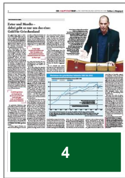
1/4 Seite quer