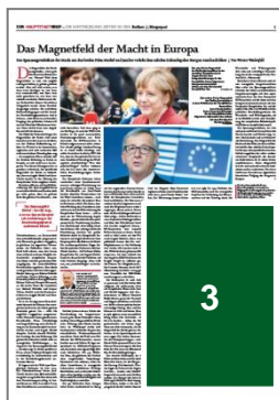
1/4 Seite Eckfeld