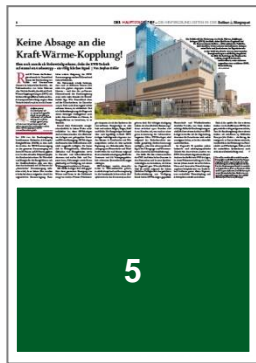
1/2 Seite quer