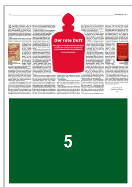
5 1/2 Seite quer