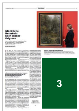
3 1/4 Seite Eckfeld