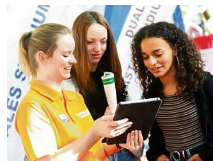
Tipps aus erster Hand: Schulabgänger erfahren in der Arena, wie eine gute Bewerbung aussieht.

Vom motivierten Ausbildungsinteressierten über den erfolgreichen Absolventen bis zum langjährig erfahrenen Akademiker und der Fach- und Führungskraft hat auf der Messe jeder die