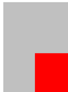
1/4 Seite Eckfeld B 184,5 mm x H 264 mm