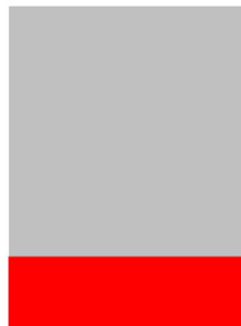
1/4 Seite quer B 375 mm x H 132 mm