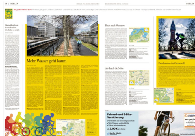
Beispiel einer redaktionellen Serie