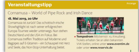
Veranstaltungstipp unter den Tagestipps auf der BERLIN HEUTE-Seite