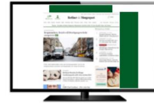
Superbanner (oben) Skyscraper (rechts)